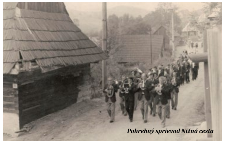
Pohrebný sprievod Nižná cesta