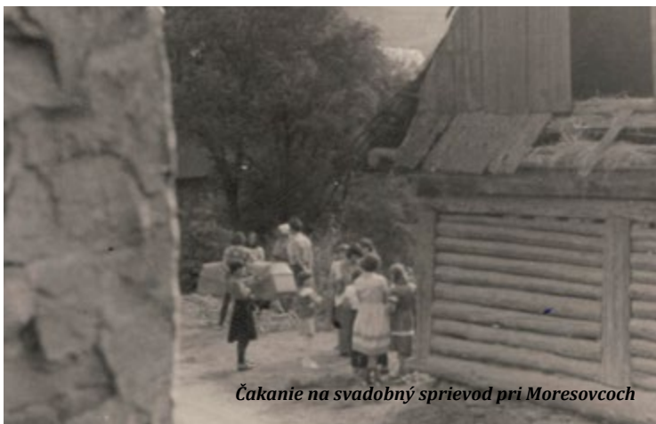
Čakanie na svadobný sprievod pri Moresovcoch