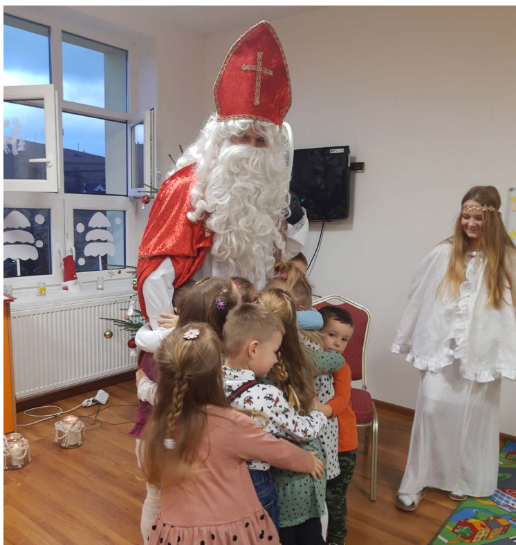
Mikuláš nezabudol ani na deti v materskej škole a zavítal poobede aj k nim. Deti poďakovali Mikulášovi za všetky deti z Pribiša úprimným objatím.