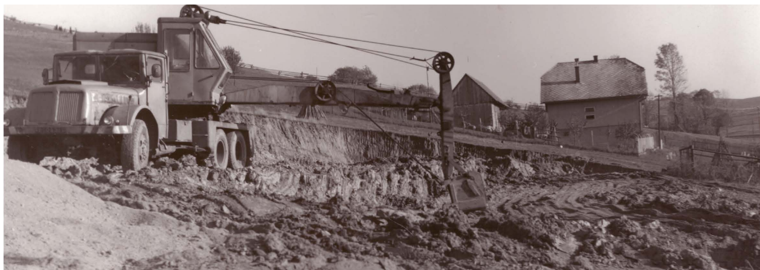
Výstavba bývalej materskej školy.