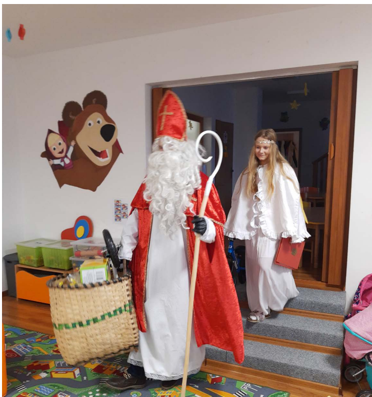
Tajomný Mikuláš rozdával darčeky deťom po obci. Nikto ho nevidel, nikto ho nepočul, ale darčeky si deti našli pri bráne domu.