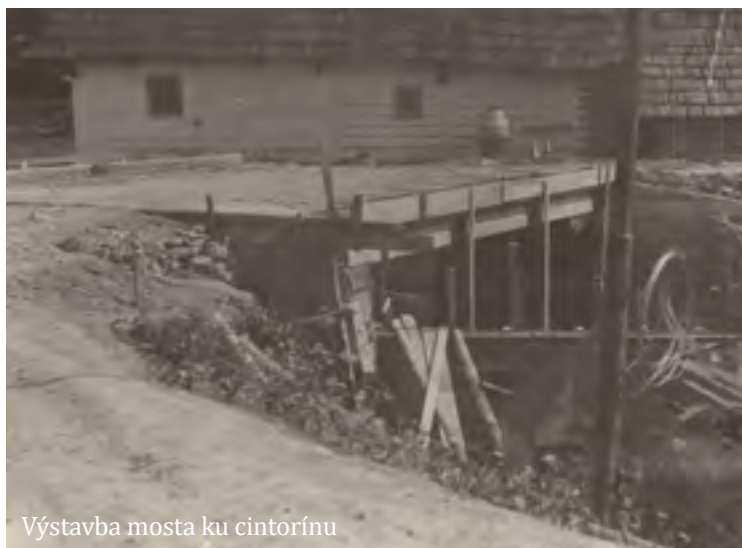
Výstavba mosta ku cintorínu