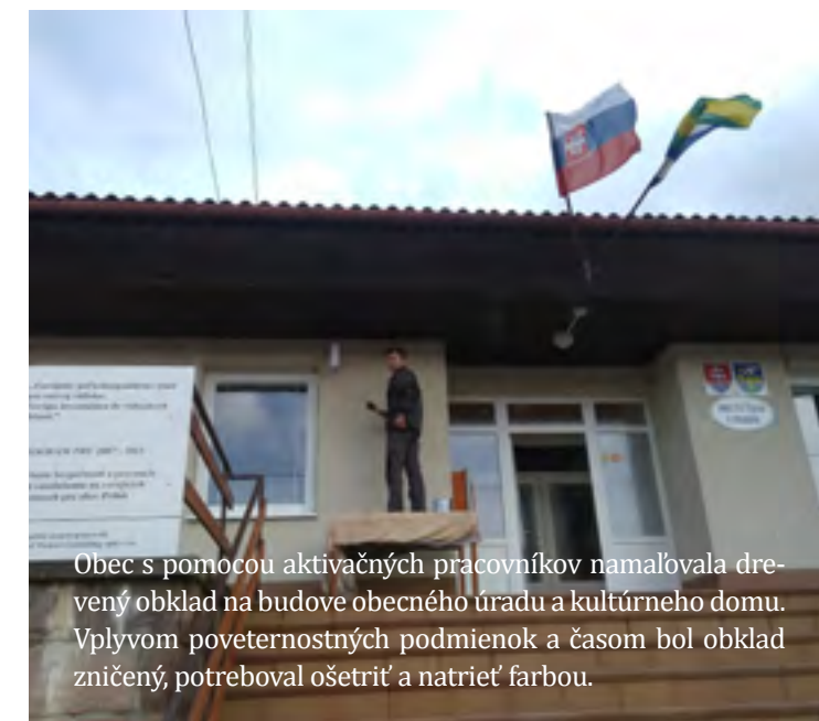
Obec s pomocou aktívnych pracovníkov namalovala drevený obklad na budove obecného úradu a kultúrneho domu. Vplyvom poveternostných podmienok a časom bol obklad zničený, potreboval ošetriť a natrieť farbou.