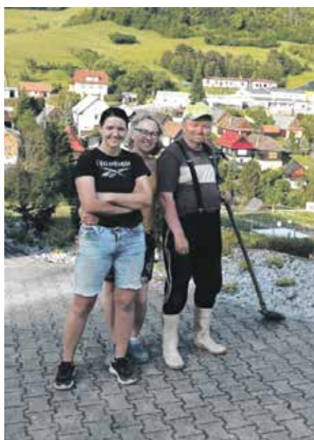
Aktivity našich obyvateľov