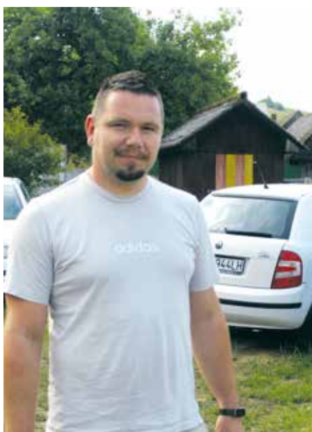
Obec získala osobné autá