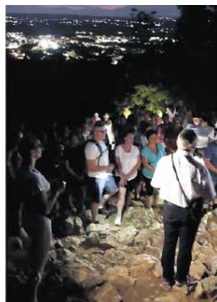
Pútnici do Ríma a Medžugoria