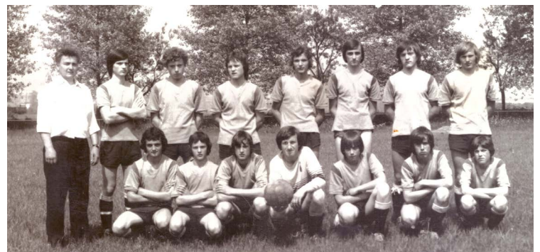
Dorastenecké mužstvo, rok 1976: