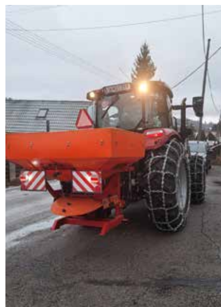
Obec kúpila sypač za traktor