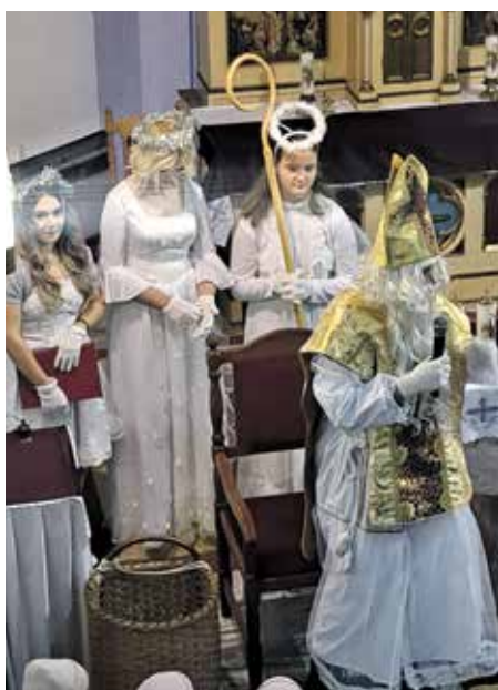
Mikuláš prišiel do kostola