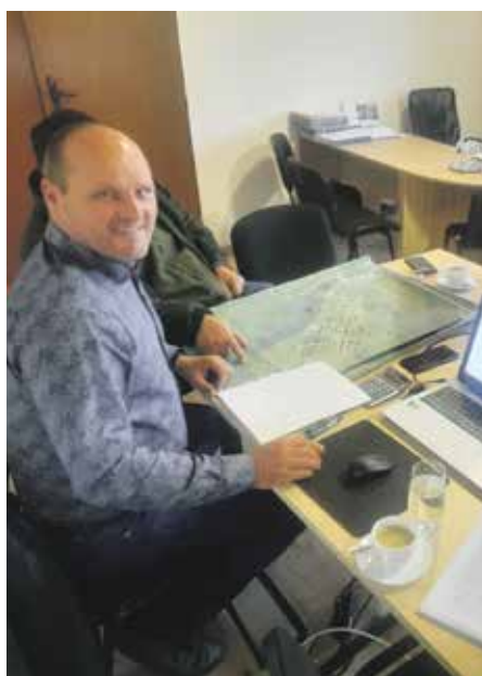
Pozemkové úpravy sú hotové